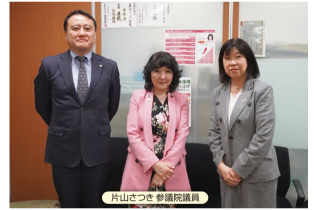
片山さつき 参議院議員