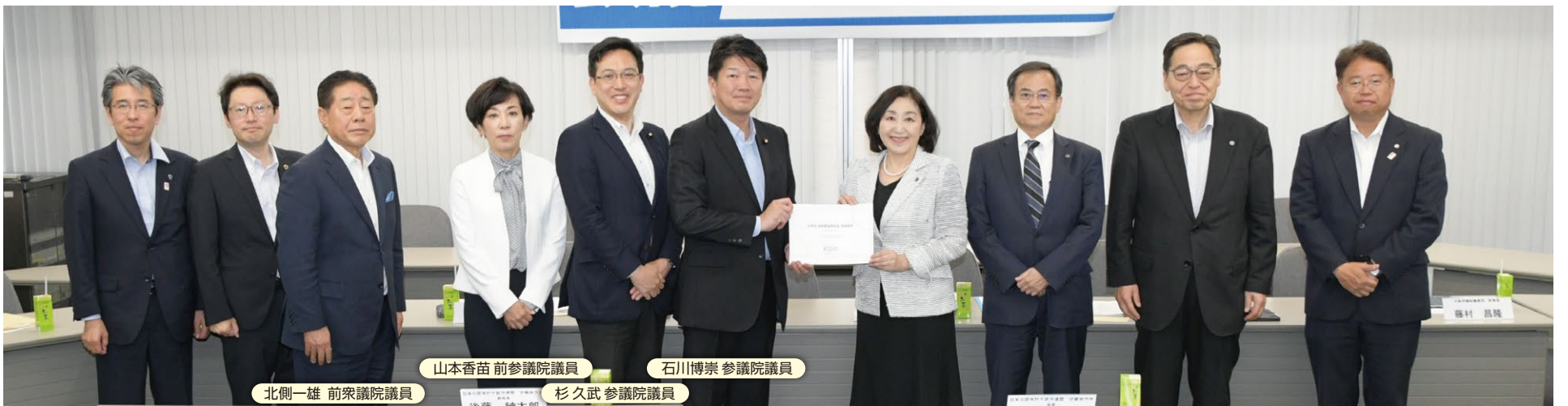
北側一雄 前衆議院議員