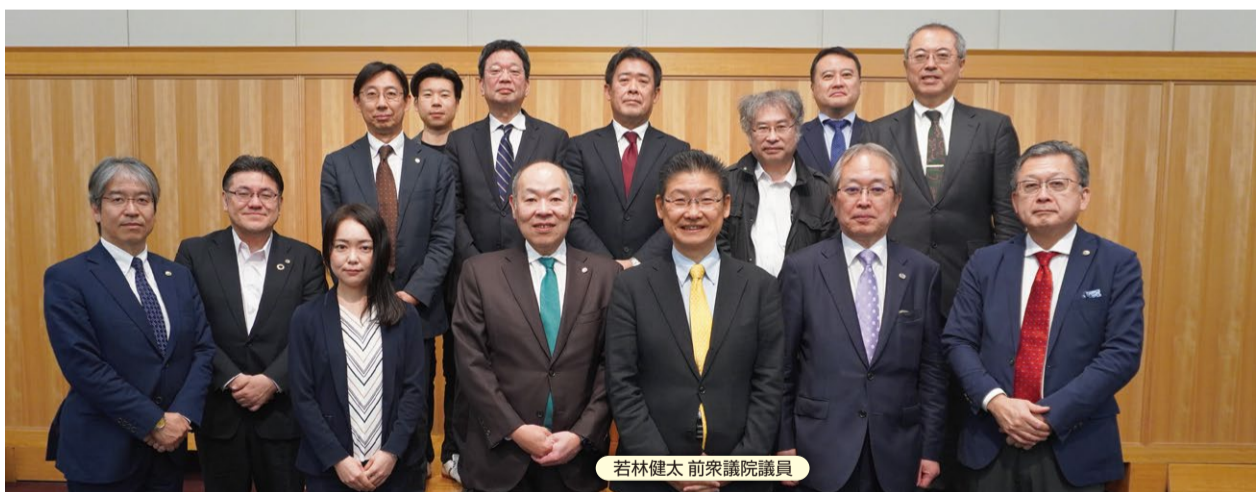
若林健太 前衆議院議員