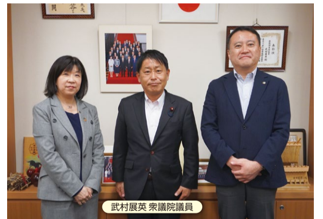
武村展英 衆議院議員