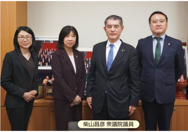
柴山昌彦 衆議院議員