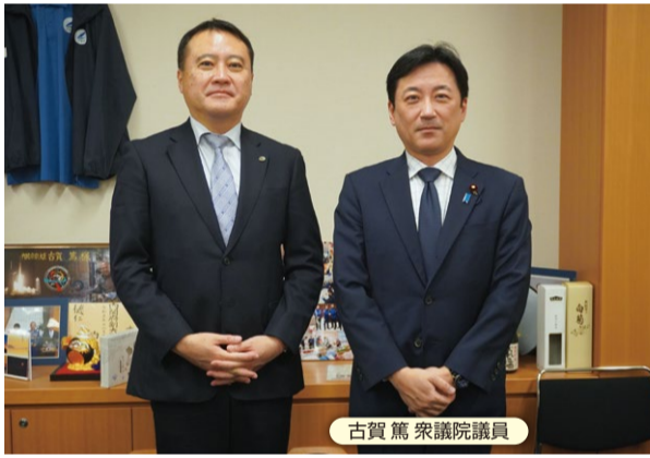
古賀 篤 衆議院議員