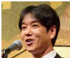
義家弘介 衆議院議員

自由民主党の財務金融部長を務めています。IFRSの任意適用をはじめ、皆様方ご要望をいただいたことをしっかりと前に進めていきたいと思ひます。