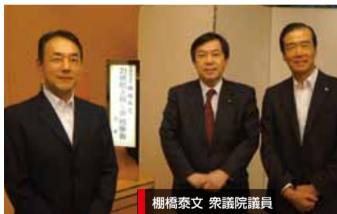
棚橋泰文 衆議院議員