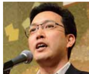
杉 久武 参議院議員

参議院の財政金融委員長に就任いたしました。世界から信頼される証券市場にするため、企業統治、企業会計の透明化にお力をお貸しください。