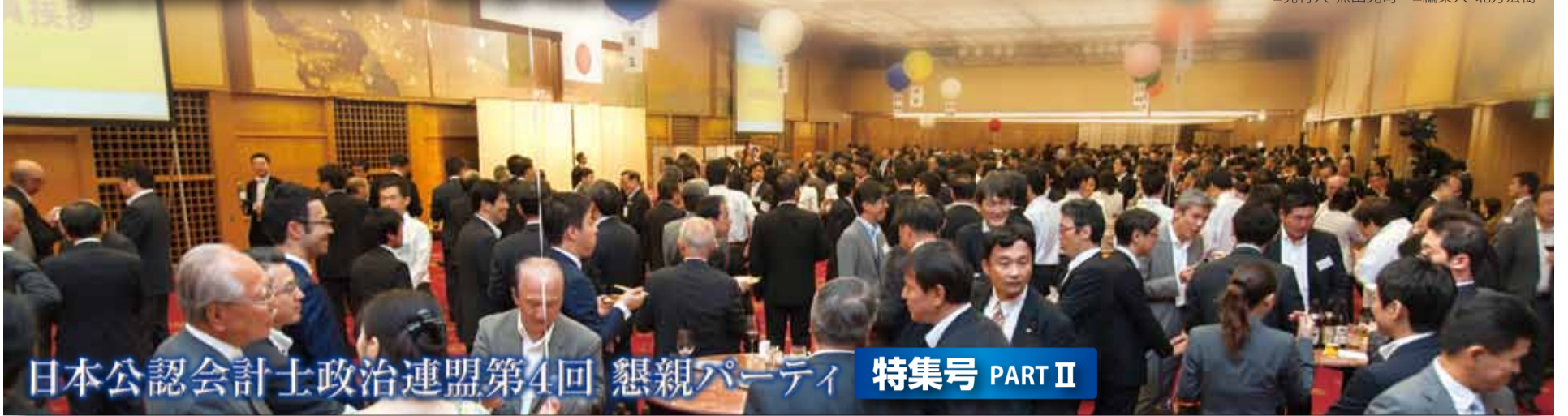
日本公認会計士政治連盟第4回 懇親パーティ 特集号 PART II

平成26年9月30日、第4回日本公認会計士政治連盟懇親パーティが開催された。今回はその特集号PART2として会場内の様子をお伝えする。