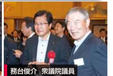
務台俊介 衆議院議員