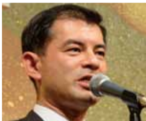
柴山昌彦 衆議院議員

自由民主党の財務金融部長を務めています。IFRSの任意適用をはじめ、皆様方ご要望をいただいたことをしっかりと前に進めていきたいと思ひます。