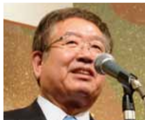
左藤 章 衆議院議員

私は福島県出身です。今度の原発事故で本当にお世話になっております。感謝申し上げます。ご挨拶に代えさせていただきます。