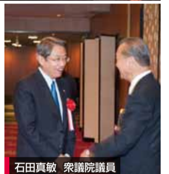
石田真敏 衆議院議員

参議院決算委員会の理事をしております。国の財政を透明化し、無駄遣いをなくし、説明責任を果たしていけるよう全力で頑張っていきます。