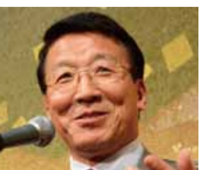
三原朝彦 衆議院議員

衛藤先生と同じ九州同士で、公正な経済社会のために、これからも皆様方が力を発揮できるよう努力させていただきます。よろしくお願ひいたします。