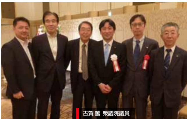
古賀 篤 衆議院議員

平成26年10月6日、ホテル日航福岡にて「衆議院議員古賀篤君と将来の日本を語る会」が開催された。古賀篤議員(自民党、福岡3区、東京大学在学中に公認会計士2次試験合格)は、平成24年の第46回衆議院議員選挙において初当選され、自由民主党公認会計士制度振興国会議員