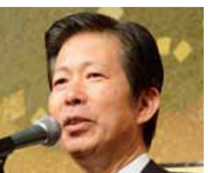
山口那津男 参議院議員