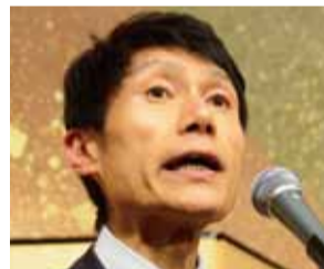
古川俊治 参議院議員

防衛副大臣兼内閣府副大臣をしております。会計では国際会計基準も含めしっかりやらなくてはなりません。皆様方のご指導をお願いします。