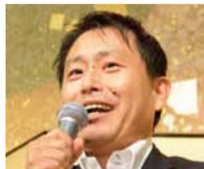
武村展英 衆議院議員

企業のグローバル化が進み、TPP交渉も佳境を迎えております。皆様は「経済安定保障の担い手」です。今後とも日本の繁栄のために力を貸してください。