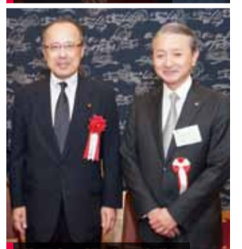
佐田玄一郎 衆議院議員

地域を元気にすることは日本を再生することだと思ひで地方創生に取り組んでいます。皆様方の知見を活かし、一緒に日本創生を実現していきたいです。