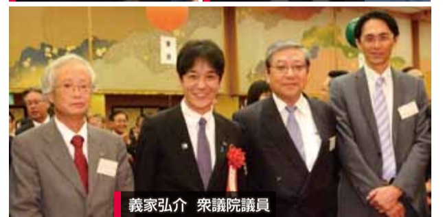
義家弘介 衆議院議員