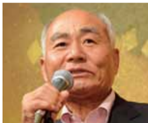
吉野正芳 衆議院議員

私はまだまだ一回生ですが、先生方の仕事が益々繁盛するように景気をよくする、これを茨城からやっていきたいと思ひます。