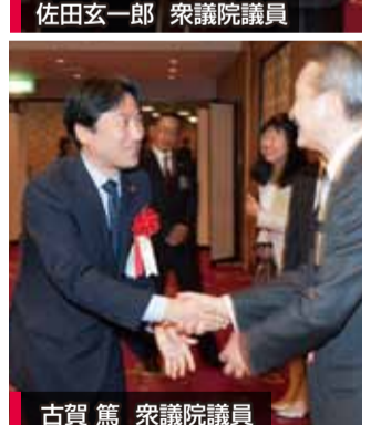
古賀 篤 衆議院議員