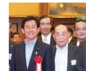
伊藤達也 衆議院議員

民主党の政調会長に就任しました。野党になりましたが、公会計、コーポレートガバナンス等、皆様方と連携を深めながらやっていきたいと思ひます。