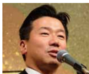
福山哲郎 参議院議員

これからも公認会計士の仕事が私たちの生活にいかにか大切かということ、自信と誇りを持って教えていただき、それに全力で応えてまいりたいと思ひます。